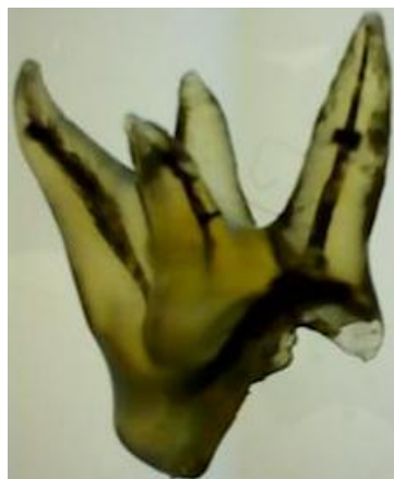
شکل ۲. نمایی از یک دندان مولر سوم فک بالای ۴ ریشه که شفاف شده است.